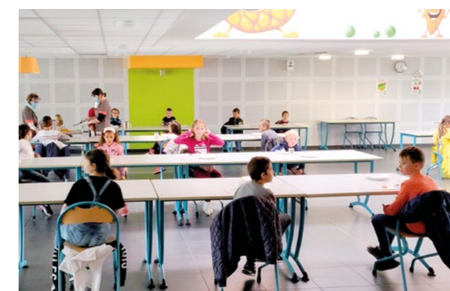
Distanciation au restaurant scolaire lors du protocole Covid - Mai 2020