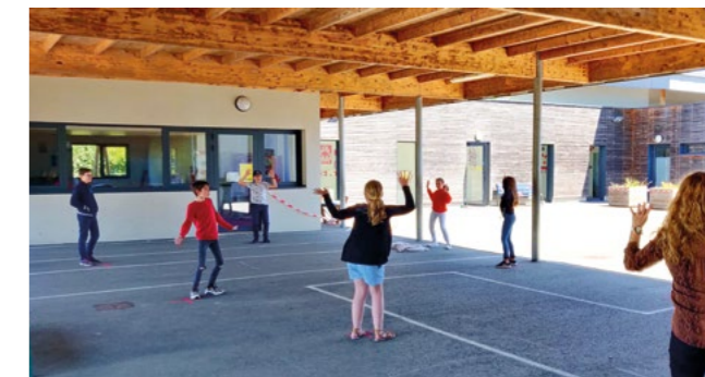
Pause méridienne à l'école élémentaire lors du protocole Covid - Mai 2020

Les salles de classes ont été réaménagées pour conserver les distances physiques. Des sens de circulation et des zones d'attentes ont été matérialisés au sol. Dans l'ensemble des bâtiments, chaque classe a bénéficié d'une entrée indépendante. La commune a fourni du savon et des produits désinfectants aux écoles publiques. Plusieurs fois par jour, les équipes d'animation et les enseignants ont été particulièrement attentifs au lavage des mains des élèves. Le service d'entretien et d'hygiène des locaux a assuré le nettoyage et la désinfection des écoles publiques sur la pause méridienne et le soir. L'accueil périscolaire a dû être réorganisé pour éviter le croisement des groupes d'élèves, ainsi chaque enfant était accueilli directement dans son école le matin et le soir. À noter le bel esprit de solidarité entre les écoles, l'école Notre-Dame Saint-Martin ayant prêté des bureaux pour permettre à l'école élémentaire d'accueillir plus d'élèves courant juin. Par ailleurs, pour accompagner les familles dans cette période compliquée, Madame Le Maire a offert la gratuité de la restauration scolaire sur le mois de mai 2020. Cet effort de la collectivité représente un coût supplémentaire de 3.391 € sur le budget communal.